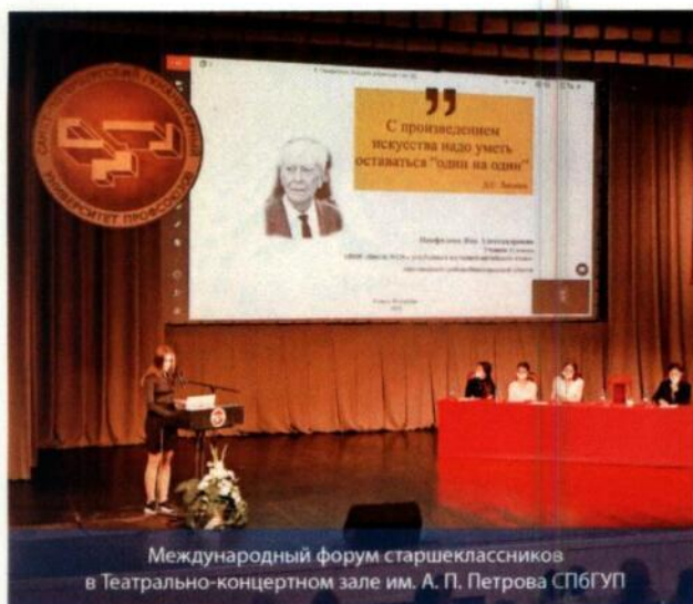
Международный форум старшеклассников в Театрально-концертном зале им. А. П. Петрова СПбГУП