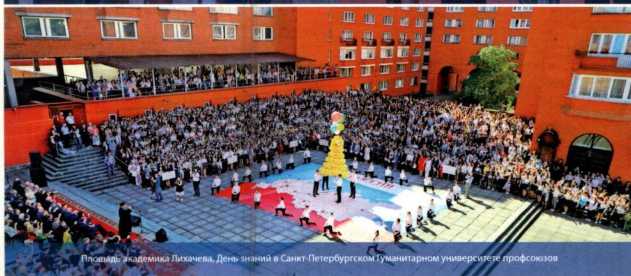
Площадь академика Лихачева, День знаний в Санкт-Петербургском Гуманитарном университете профсоюзов